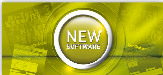
Software Centro 5.9 Beta