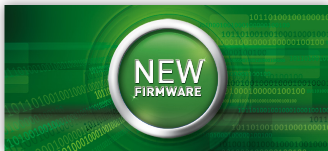
Firmware 1.4 centrale Evolution